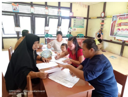
Gambar 2. Pendampingan dan Monitoring

Belajar membaca dibagi dalam tiga tahapan, 6% yang belajar membaca tahap 1, 2, dan 3. Berdasarkan pre-test sebesar 11 orang mampu membaca dari 55 orang peserta. Setelah mengikuti pembelajaran membaca tahap 1, dilakukan evaluasi tahap pertama dimana peserta yang mampu membaca meningkat menjadi 13 orang dibandingkan pada pre-test . Pada evaluasi tahap kedua terjadi peningkatan jumlah peserta yang mampu membaca meningkat menjadi 28 orang, dan evaluasi tahap ketiga meningkat menjadi 35 orang peserta dapat membaca dan pada post-test terjadi peningkatan sebesar 38 orang dari jumlah peserta yang sudah bisa membaca.