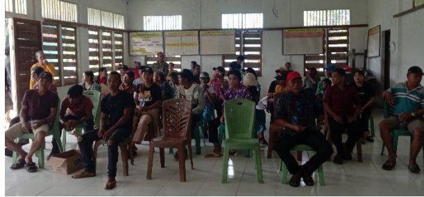
Gambar 1. Sosialisasi Pemberantasan Buta Aksara