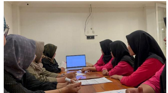
Gambar. 5. Foto Kegiatan Pengabdian

Pencatatan laporan keuangan merupakan hal yang sangat penting di dalam proses bisnis, melihat salah satu permasalahan yang ditemukan di Mina Group adalah pemilik dan karyawan masih melakukan pencatatan secara manual. Tim pengabdian memberikan pelatihan mengenai software yang bisa digunakan salah satunya menggunakan software Excel, dan pencatatan menggunakan aplikasi buku warung. Pengelolaan keuangan yang baik dan transparan memerlukan pengetahuan dan keterampilan, Kemudian peserta bergantian melakukan praktek dalam pencatatan keuangan, peserta antusias ketika melakukan praktek pencatatan keuangan.