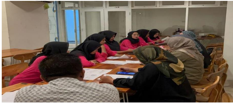
Gambar. 4. Foto Kegiatan Pengabdian

Kedua, pengabdian masyarakat yang dilakukan di Mina Group memberikan pelatihan pengembangan strategi usaha berbasis financial and technology sebagai upaya membantu pencatatan keuangan lebih mudah dan berbasis online. Administrasi keuangan yang digunakan masih sangat tradisional, yaitu tidak ada pencatatan keuangan masuk dan keluar dan tidak ada buku khusus yang digunakan untuk arus keuangan. Tim Pengabdian memberikan pelatihan penyusunan laporan keuangan.. Faktor yang mempengaruhi sulitnya penerapan pembukuan atau pembuatan laporan keuangan diantaranya faktor internal yaitu ketidakpahaman mengenai tata cara penyusunan laporan keuangan, ketidaktahuan anggota mengenai manfaat melaksanakan pencatatan keuangan, ketidakdisiplinan dalam melaksanakan pencatatan keuangan, kekurangan SDM dalam melakukan pencatatan keuangan, serta ketidaksiapan sarana dan prasarana seperti komputer untuk mendukung pembuatan laporan keuangan. Faktor eksternal kendala sulit diterapkannya praktek pemubukuan yaitu tidak adanya pengawasan, kurangnya fasilitator atau pendampingan dalam membuat laporan keuangan (8).