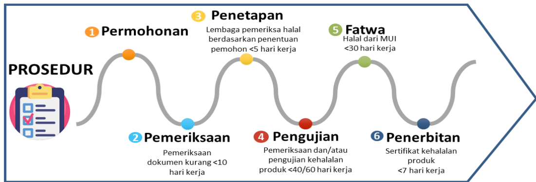
Gambar. 2. Langkah Pengajuan Sertifikasi Halal

Brand Image yang bersifat Halal telah mendapat perhatian yang cukup luas dikalangan akademisi dan praktisi dalam beberapa tahun terakhir. Hal ini mengingat populasi muslim didunia yang semakin bertambah. Beberapa ahli mengemukakan bahwa konsep Halal branding semakin diminati oleh para produsen. Produk yang menargetkan konsumen muslim biasanya memiliki desain produk yang menggambarkan halal brand image. Pemilihan nama produk yang islami dan kemasan di desain islami juga, seperti menggunakan gambar, font dan simbol islami. Selain itu ada satu hal penting yang harus tercantum di kemasan produk yang membangun halal brand image, yaitu logo halal. Logo halal di kemasan produk menjadi informasi yang akan memberikan rasa yakin kepada konsumen untuk membeli produk (6).