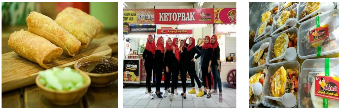
Gambar. 1. Produk dan Pegawai Mina Group

Mina Group merupakan salah satu bentuk UMKM yang bergerak dalam Food and Beverage yang berada di Jl.Suryotomo No.29, Ngupasan, Kec. Gondomanan, Kota Yogyakarta, Daerah Istimewa Yogyakarta 55122. Daerah Istimewa Yogyakarta. Berakhirnya pandemi Covid 19 menyebabkan kondisi perekonomian yang perlahan mulai membaik walaupun penurunan Laba yang sangat signifikan sehingga jumlah karyawan ikut berkurang diakibatkan pandemi pada tahun sebelumnya.