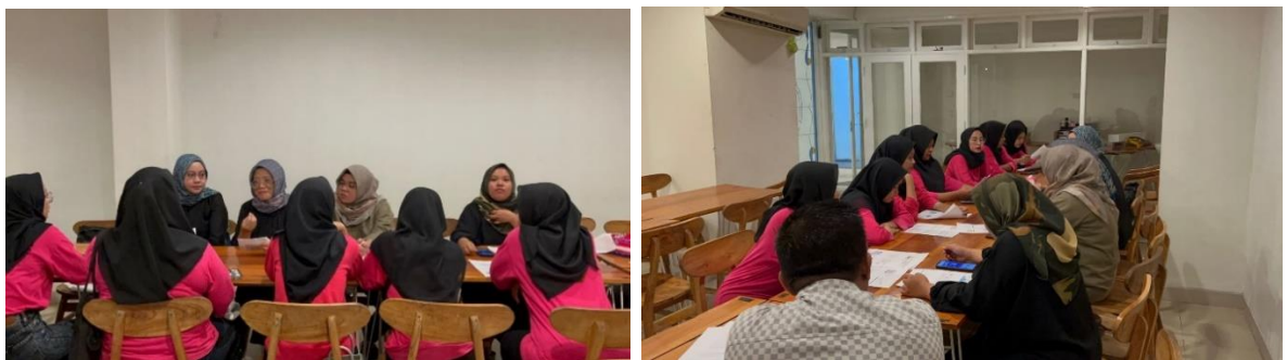
Gambar 4. Foto Kegiatan Pengabdian dan Pengabdian Pencatatan Keuangan berbasis teknologi

Hambatan yang sering dihadapi oleh UMKM dalam pencatatan keuangan yang rapi dan berbasis teknologi diantaranya ketidakpahaman Teknologi, Biaya Implementasi yang tinggi, Keterbatasan Sumber Daya Manusia, Kurangnya Akses Internet yang Stabil dan Perubahan dalam Proses Bisnis: Implementasi teknologi untuk pencatatan keuangan dapat mengharuskan UMKM untuk merombak atau mengubah proses bisnis mereka. Ini mungkin tidak selalu mudah atau praktis untuk dilakukan.. Selain itu terdapat pula faktor lain berupa kurangnya pengawasan dan kurangnya bantuan fasilitator atau pendampingan dalam proses penyusunan laporan keuangan (Wijayanti, Suratman, Sugiyanto, 2010).