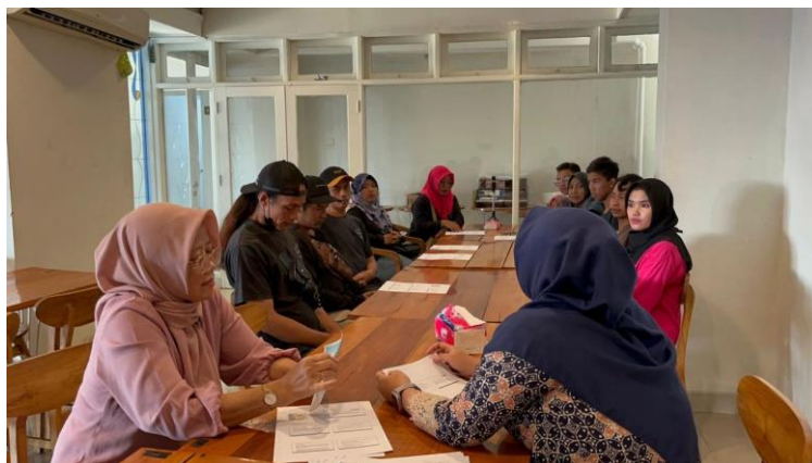
Gambar 3. Foto Kegiatan Materi Peningkatan Manajemen dan Kualitas Usaha

Mitra pengabdian diajak menganalisis permasalahan yang seringkali dihadapi UMKM yang dapat dibagi menjadi tiga kategori, yaitu (1) masalah dasar yang mencakup isu-isu seperti permodalan, struktur hukum yang cenderung tidak formal, tenaga kerja, inovasi produk, dan akses ke pasar, (2) permasalahan tingkat lanjut yang mencakup tantangan seperti penetrasi pasar, ekspor yang belum optimal, pemahaman yang kurang terhadap desain produk yang sesuai dengan pasar, masalah hukum terkait hak paten, prosedur kontrak penjualan, dan regulasi di negara tujuan ekspor, serta (3) permasalahan yang berada di antara, seperti manajemen keuangan, agunan, dan keterbatasan dalam aspek kewirausahaan (Syamsudin dkk, 2021). Selain itu dibahas juga bagaimana UMKM perlu bersikap fleksibel dengan perubahan. Kemampuan ini merujuk pada kemampuan untuk memahami perubahan dalam perilaku konsumen dan tuntutan pasar sesuai dengan kondisi lingkungan. Dalam konteks UMKM, lingkungan ini terdiri dari dua aspek, yaitu lingkungan yang ada di dalam perusahaan dan yang ada di luar perusahaan, yang sering disebut sebagai pihak terkait. Oleh karena itu, UMKM harus memiliki kemampuan untuk mengelola hubungan dengan pihak terkait guna menciptakan inovasi dalam strategi pengembangan bisnisnya (Albats, Alexander, Mahdad, Miller, & Post, 2019)