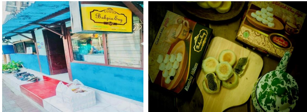
Gambar 1. Produk dan Tempat Usaha Bakpia Eny 523

Berdasarkan hasil prasarvei awal teridentifikasi bahwa secara umum keberadaan usaha bakpia ini memiliki beberapa kelemahan. Pertama , meskipun telah dikelola sejak beberapa tahun lalu perkembangannya sangat lambat dan cenderung stagnan. Orientasi pengembangan usaha cenderung sebatas keinginan dan belum disertai dengan motivasi kuat dan kemampuan manajerial dari sisi kelembagaan. Kedua usaha ini memiliki permasalahan dalam hal pengembangan usaha, tidak adanya standar operasi yaitu dalam bahan baku, proses produksi, pengembangan penetrasi pasar dan keuangan yang belum tercatat dengan baik serta masih menggabungkan keuangan keluarga dengan keuangan perusahaan menyebabkan usaha Bakpia Eny 523 masih kesulitan dalam mengakses pendanaan dari pihak internal akibat portfolio bisnis yang tidak tertata dengan baik.