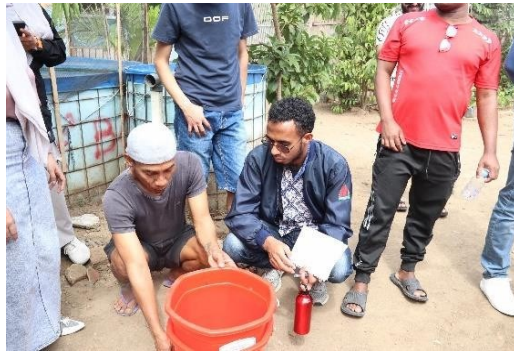
Gambar 4a. Kunjungan ke Area Budidaya Ikan Lele

pengelolaan pariwisata berbasis komunitas. Interaksi antara peserta internasional dan warga dusun juga menciptakan ruang pertukaran pengetahuan dan pengalaman lintas budaya, memperkaya pemahaman mereka terhadap penerapan Community-Based Tourism (CBT) di tingkat lokal. Kegiatan kunjungan memperlihatkan pentingnya kemitraan multi-pihak dalam memperkuat praktik CBT, keberhasilan penerapan CBT di Desa Wisata Mekarsari ditentukan oleh keterlibatan aktif masyarakat bersama perguruan tinggi dan pemerintah daerah. Melalui pengalaman langsung ini, peserta tidak hanya memperoleh wawasan teoretis, tetapi juga menyaksikan praktik nyata pemberdayaan masyarakat di tingkat dusun. Interaksi lintas budaya antara peserta internasional dan warga lokal juga memperkuat aspek kolaborasi dan pertukaran pengetahuan yang menjadi inti dari kegiatan International Summer Course . Gambar 4a menyajikan momen saat peserta mengunjungi area budidaya ikan lele dan Gambar 4b menyajikan dokumentasi saat peserta mengunjungi area pengolahan limbah organik menjadi kompos.