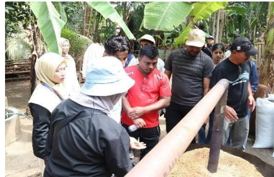
Gambar 4b. Kunjungan ke Area Pengolahan Limbah Organik