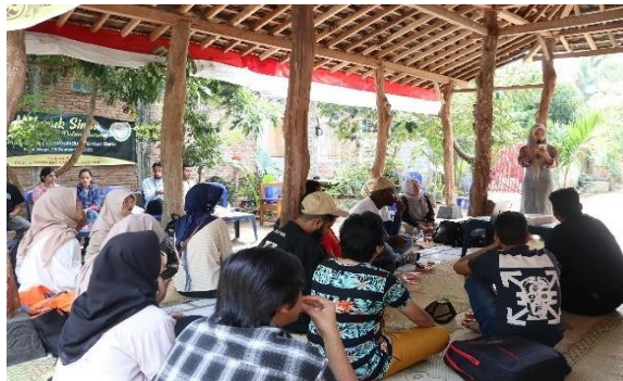
Gambar 3. Kegiatan Pedukuhan Edukowisata Ngungan-ngungan.

Kegiatan pengabdian selanjutnya adalah Focus Group Discussion , narasumber, peserta dan pengelola eduekowisata Ngungan-ngungan. Pada kegiatan ini peserta melakukan tanya jawab dengan narasumber dan pengelola eduekowisata. Peserta diajak berdiskusi dalam kelompok untuk merumuskan rencana pengembangan wisata desa, yang dilanjutkan dengan observasi potensi wisata lokal dan simulasi peran seperti pemandu wisata atau pelaku usaha pendukung pariwisata. Pertanyaan berkaitan dengan konsep serta implementasi Community Based Tourism di Pedukuhan Ngungan-ngungan sebagai lokasi eduekowisata Ngungan-ngungan merupakan wisata berbasis komunitas. Gambar 3 menyajikan proses Focus Group Discussion .