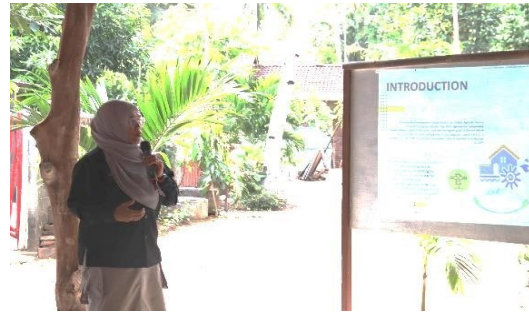
Gambar 2b. Pemberian Materi Community-Based Tourism