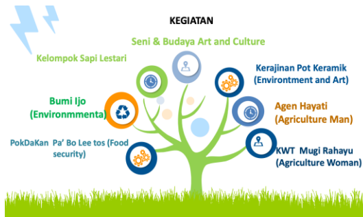
Gambar 2a. Kegiatan Pedukuhan Edukowisata Ngungan-ngungan