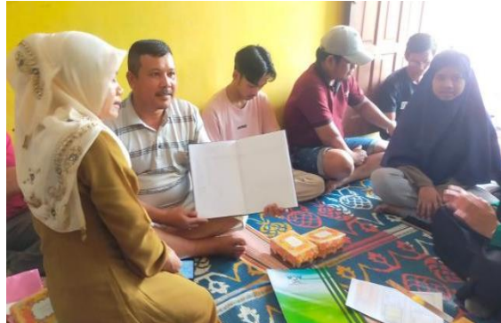
Gambar 4. Percontohan Penyusunan Arus Kas Dan Laporan Keuangan

Pada tahapan ini tim pengabdian memberikan pendampingan berupa percontohan tata cara pencatatan arus kas hingga tersusunnya sebuah laporan keuangan yang berlaku secara umum kepada kelompok budidaya ikan lele gunung sarik kota padang. Kegiatan ini dapat dilihat pada gambar di bawah ini;