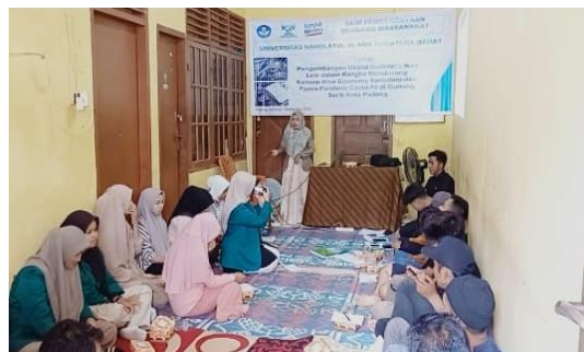
Gambar 3. Pemaparan Materi, Diskusi dan Tanya Jawab

Kegiatan ini berbentuk pemaparan materi oleh tim pelaksana kegiatan pengabdian dan kemudian di lanjutkan dengan diskusi dan tanya jawab seputar pencatatan arus kas dan penyusunan laporan keuangan. Kegiatan ini dapat dilihat pada gambar di bawah ini: