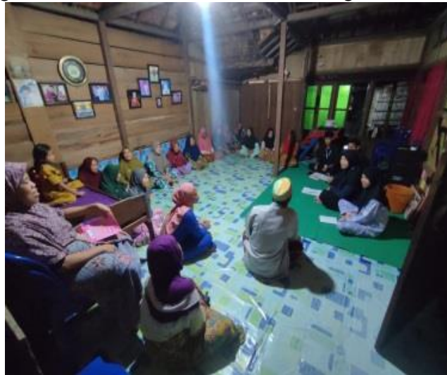
Gambar 3. Kegiatan Pojok Literasi Lansia

Kegiatan literasi yang diterapkan di kalangan lansia membantu lansia dalam hal melatih kepercayaan diri dengan adanya kegiatan menulis dan membaca serta diajarkan cara untuk menulis resep masakan yang sering mereka masak serta menulis biodata diri dan menceritakan kegiatan keseharian mereka melalui autobiografi.