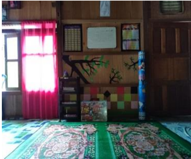
Gambar 2. After Pojok Literasi lansia

Kegiatan literasi yang diterapkan di kalangan lansia membantu lansia dalam hal melatih kepercayaan diri dengan adanya kegiatan menulis dan membaca serta diajarkan cara untuk menulis resep masakan yang sering mereka masak serta menulis biodata diri dan menceritakan kegiatan keseharian mereka melalui autobiografi.