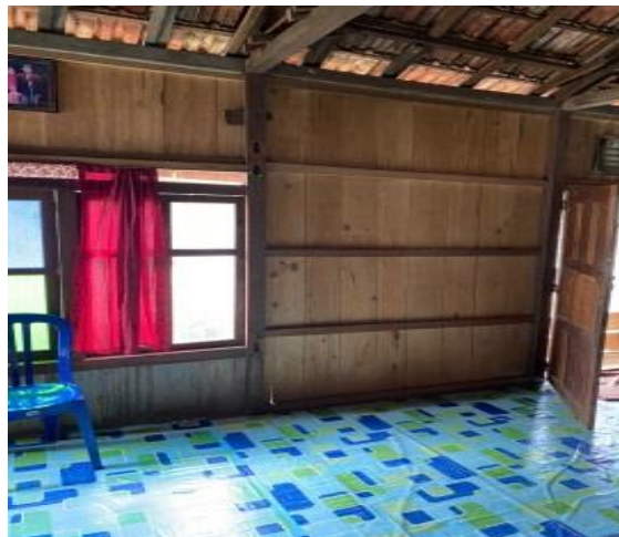
Gambar 1. Before Pojok Literasi lansia

Pojok literasi merupakan sebuah sudut baca di suatu ruangan yang dilengkapi dengan koleksi buku yang ditata secara menarik untuk menumbuhkan minat baca. Kegiatan belajar mengajar di pojok literasi lansia dilaksanakan pada hari senin sampai sabtu yang dimulai dari pukul 19.30 s/d pukul 21.00 WIB. Antusias warga Desa Napallicin yang sangat tinggi sehingga kegiatan belajar mengajar di pojok literasi dapat terlaksana dengan baik. Pada kegiatan ini yang kami lakukan berupa mengenalkan alfabet, melatih kemampuan menulis dan membaca serta melatih kemampuan berbahasa Indonesia. Hal ini sesuai dengan tujuan dari adanya umah macuy yang kehadirannya berfungsi untuk menumbuhkembangkan kemampuan verbal dan non verbal, budaya membaca, menjadi sarana pembelajaran sepanjang masa, dan mewujudkan masyarakat yang memiliki pengetahuan dan keterampilan menuju kemandirian secara bertanggung jawab (Kementerian Pendidikan dan Kebudayaan, 2017).