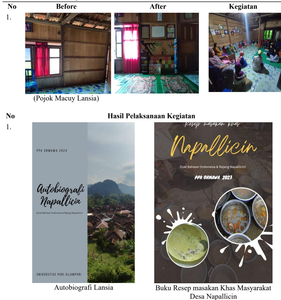
Tabel 1: Pelaksanaan kegiatan