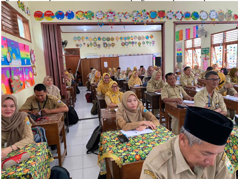
Gambar 2. Pelatihan Pembelajaran Berdiferensiasi dan Assesmennya pada Guru SD