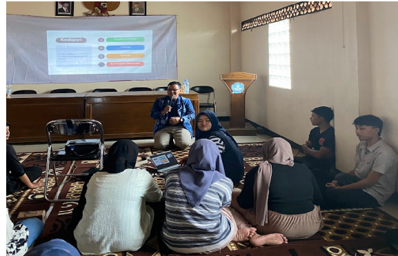
Gambar 3. Pelatihan keterampilan emosional