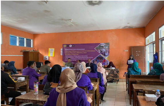
Gambar 2. Forum Group Discussion