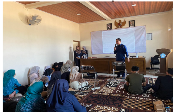
Gambar 5. Pendidikan dan penyuluhan diadakan kepada orang tua dan guru

Informasi dasar mengenai kesehatan mental juga disebarluaskan melalui leaflet dan media sosial. Evaluasi dilakukan dengan survei dan umpan balik untuk mengukur keberhasilan dan melakukan penyesuaian. Kolaborasi dengan puskesmas, organisasi lokal, dan lembaga pendidikan setempat memastikan dukungan yang berkelanjutan. Berikut adalah hasil yang diperoleh dari berbagai kegiatan yang telah dilakukan: