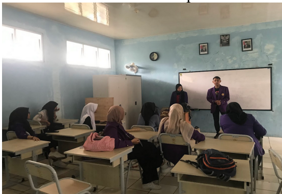
Gambar 4. Pembentukan kelompok dukungan sebaya