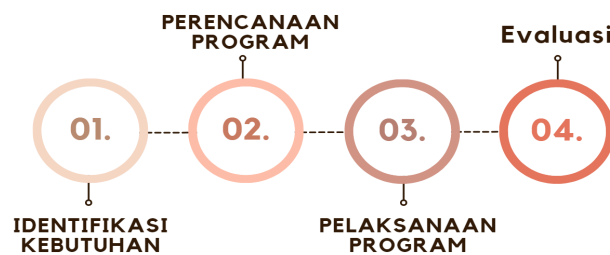
Gambar 1. Flowchart alur kegiatan pengabdian kepada masyarakat

Evaluasi program dilakukan dalam dua tahap: formatif dan sumatif. Evaluasi formatif dilakukan selama pelaksanaan program untuk memantau kemajuan dan mengidentifikasi kebutuhan penyesuaian. Evaluasi sumatif dilakukan setelah program selesai, bertujuan untuk menilai dampak keseluruhan dari program.