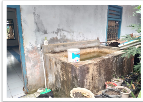
Gambar 1. Kondisi tempat wudhu sebelum program pengabdian.

Dari berbagai permasalahan tersebut, dipilih satu permasalahan utama yang mendesak untuk diselesaikan, yaitu minimnya pembinaan mengenai konservasi lingkungan berbasis masjid.