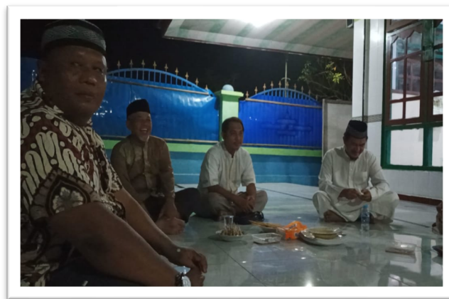
Gambar 4. Dokumentasi perencanaan program.