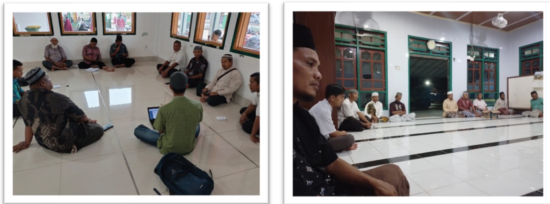
Gambar 3. Dokumentasi kegiatan sosialisasi program.

Langkah awal dalam melaksanakan kegiatan pengabdian adalah memberikan sosialisasi tentang urgensi dari kegiatan masyarakat ini. Sosialisasi dilaksanakan di Masjid Al- Ardi kecamatan Aimas Kabupaten Sorong. Setelah melakukan sosialisasi maka disepakati program kerja akan dilaksanakan. Pengurus masjid sepakat bahwa pelaksanaan kegiatan dilaksanakan ketika pengajian rutin setiap hari sabtu. Alasannya adalah para jamaah sudah hafal pada hari itu akan dilaksanakan pengajian rutin. Sehingga agar atensi jamaah besar tidak perlu menambah waktu lagi.