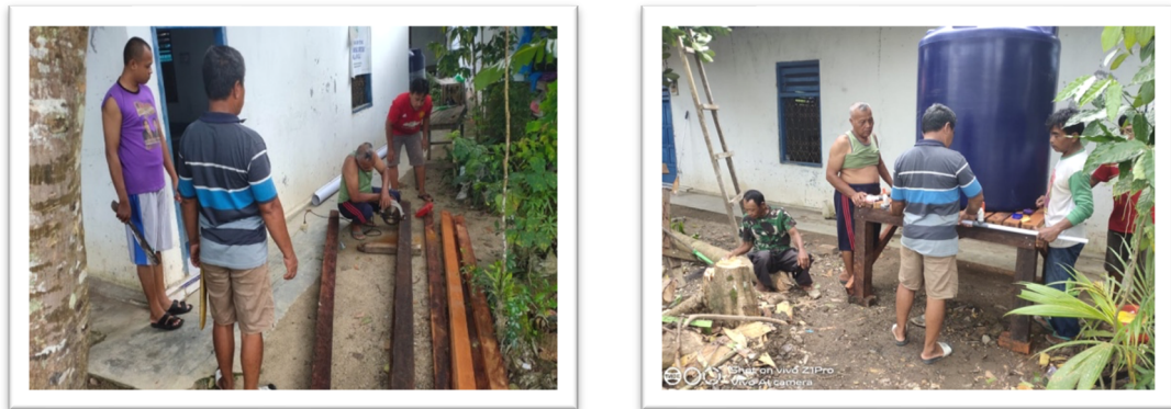
Gambar 5. Dokumentasi kegiatan pengabdian.

Setelah kegiatan sosialisasi dan pelatihan yang dilakukan dalam program pengabdian ini, terjadi peningkatan signifikan dalam pemahaman jamaah mengenai konsep Masjid Hijau. Hasil wawancara dan observasi sebagaimana disajikan pada gambar 6, menunjukkan bahwa mayoritas jamaah mulai memahami pentingnya praktik ramah lingkungan dalam aktivitas keagamaan di masjid. Sebelum program ini diterapkan, kesadaran jamaah terhadap dampak penggunaan air wudhu yang berlebihan masih rendah, dan perhatian terhadap pengelolaan sampah di sekitar masjid juga kurang. Dari hasil kuesioner evaluasi, terlihat adanya perubahan pola pikir jamaah setelah mengikuti kegiatan ini, terutama dalam hal pengelolaan air wudhu dan kebersihan lingkungan masjid. Kesadaran ini penting karena masjid, selain sebagai tempat ibadah, juga memiliki peran sosial dan edukatif dalam membentuk perilaku masyarakat yang lebih peduli terhadap lingkungan.