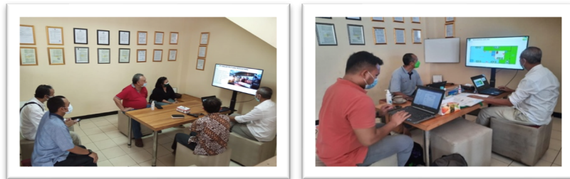
Gambar 4. Dokumentasi penyusunan modul pelatihan.