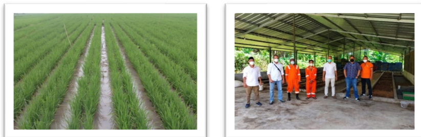
Gambar 3. Dokumentasi survei kebutuhan masyarakat.