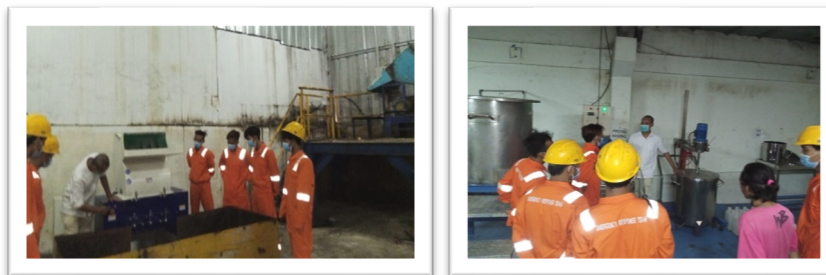
Gambar 5. Dokumentasi proses pembuatan dan pemanfaatan pupuk cair.