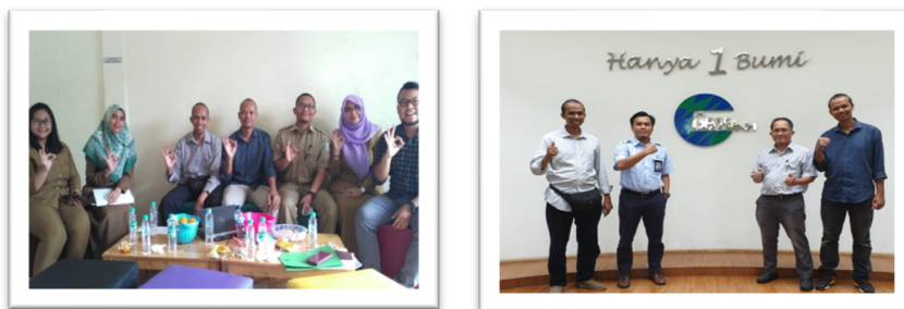
Gambar 2. Dokumentasi koordinasi dan kolaborasi dengan organisasi masyarakat.