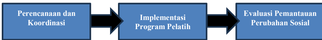
Gambar 1. Diagram alur kegiatan pengabdian masyarakat.

Pendekatan partisipatif melibatkan masyarakat dalam perencanaan, implementasi, dan evaluasi program. Selain itu, pendekatan ini berfokus pada solusi dengan berfokus pada pemberdayaan masyarakat melalui transfer teknologi yang dapat diterapkan secara langsung (Menerey, 1994). Kegiatan ini dilakukan secara kolektif dan melibatkan berbagai pemangku kepentingan seperti PT. Siklus Mutiara Nusantara, organisasi masyarakat, dan orang-orang yang bekerja dalam pertanian dan pengolahan limbah organik. Untuk menentukan kebutuhan, proses pengabdian ini menggunakan pendekatan ilmiah dan mengamati perubahan sosial. Observasi langsung di lokasi pengolahan limbah dan lahan pertanian di sekitarnya, wawancara mendalam dengan petani dan pengusaha lokal, dan kuesioner untuk menilai pemahaman dan keterampilan peserta sebelum dan sesudah pelatihan semuanya digunakan untuk mengumpulkan data. Selain itu, perspektif yang lebih mendalam dari masyarakat dan organisasi mitra dapat diperoleh melalui diskusi kelompok terfokus (FGD). Strategi ini diharapkan dapat menghasilkan program pemberdayaan yang efektif dan memiliki dampak sosial yang signifikan pada masyarakat sekitar. Kegiatan pengabdian masyarakat ini dilakukan pada tanggal 1 November 2024 dengan bekerja sama dengan PT. Siklus Mutiara Nusantara yang terletak di Kawasan Industri Jababeka Tahap 6 Cikarang Utara, Kabupaten Bekasi. Adapun proses pengabdian ini adalah sebagai berikut: