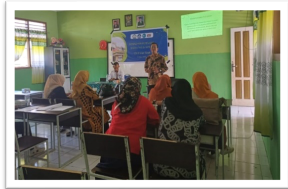
Gambar 3. Dokumentasi penjelasan materi oleh narasumber.