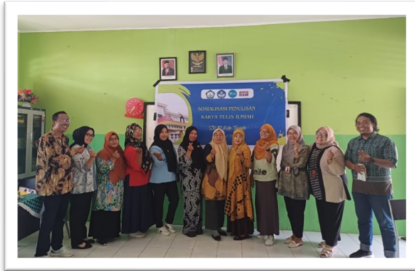
Gambar 2. Dokumentasi bersama tim & peserta pengabdian.

tersebut berharap ada kegiatan lanjutan untuk dilakukan pembimbingan menulis hingga publikasi. Hal ini juga timbul pada poin nomor 7, dimana terdapat satu guru yang tidak setuju dengan kegiatan bertema lain. Guru tersebut ingin fokus menyelesaikan satu tugas penulisan terlebih dahulu. Data tersebut diperkuat kembali pada poin nomor 9. Sebanyak 58,3% peserta menyetujui untuk keberlanjutan dari kegiatan sosialisasi.