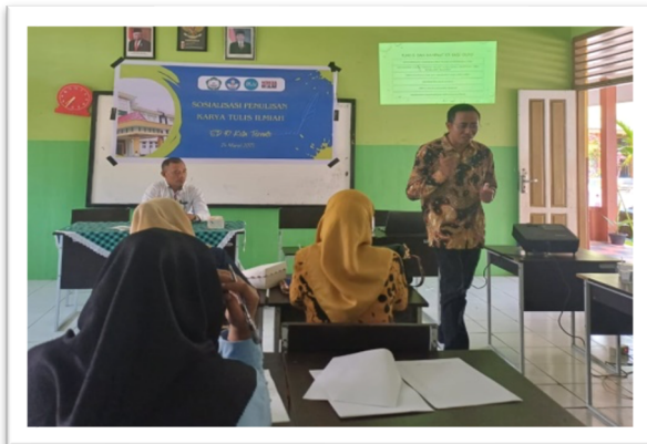
Gambar 4. Dokumentasi sesi tanya jawab.