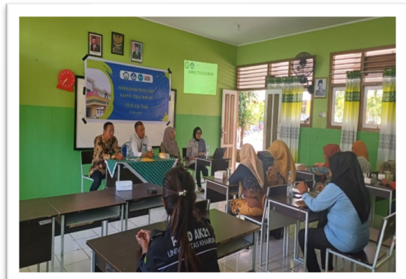
Gambar 5. Dokumentasi sesi diskusi bersama.