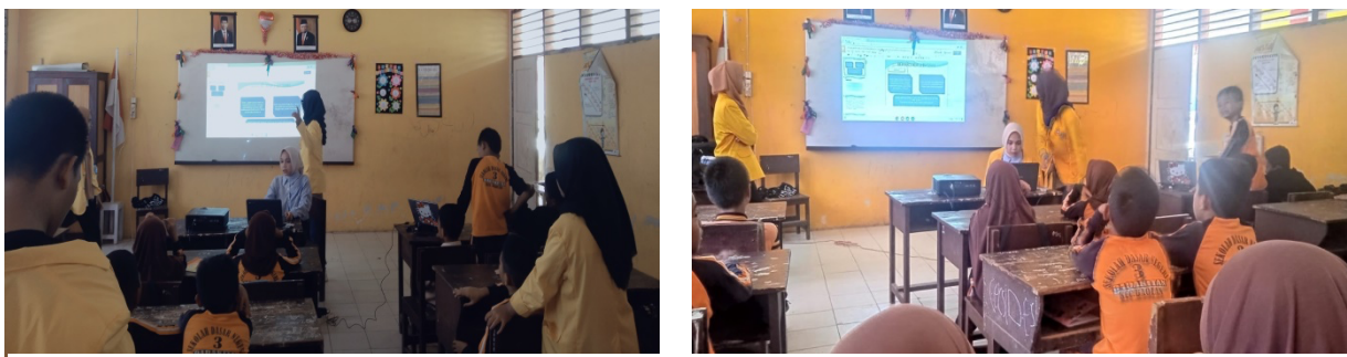
Gambar 3. Menjelaskan materi tentang Mandi wajib.

Penyajian materi yang di berikan berbentuk ceramah dan diskusi. Metode pemberian materi dilaksanakan secara interaktif. Langkah awal kegiatan diawali dengan pengenalan oleh mahasiswa atau tim yang melakukan pengabdian kepada masyarakat (PKM). Berikutnya mencari tau pengetahuan peserta didik mengenai awal materi terkait tata cara sholat, wudhu, tayammun, dan mandi wajib. Setelah itu tim mahasiswa atau tim PKM memaparkan materi mengenai sholat, wudhu, tayammun, dan mandi wajib. Dan selanjutnya peserta didik dan tim mahasiswa atau tim pengabdian kepada masyarakat melakukan praktek bersama mengenai sholat, wudhu, tayammun dan mandi wajib.