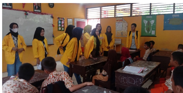
Gambar 1. Perkenalan Tim Pengabdian

Kegiatan ini dilakukan di sekolah yang telah ditentukan sebagai bentuk upaya pengemplantasian dari mata kuliah pendidikan agama. Dilakukannya kegiatan ini sebagai bentuk pengabdian kepada masyarakat yang telah dilaksanakan di sekolah SDN 3 Dadakitan dengan jumlah peserta didik 21 orang dari kelas 6, pelaksanaan pengabdian kepada masyarakat (PKM) dengan pemaparan materi “Pentingnya Pembelajaran Sholat dan Thaharah yang meliputi Wudhu, Tayammum dan Mandi Wajib”. Sebagai generasi yang