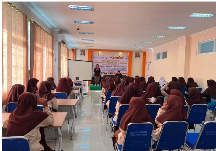
Gambar 3.1 Peserta pengabdian pelajar MAN Kota Sorong