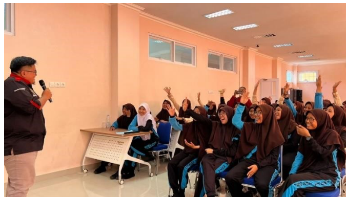
Gambar 3.2 Antusias tanya jawab pelajar MAN Kota Sorong